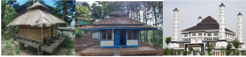
Gambar 1, 2 dan 3. Atap Tajug untuk Mushola Pribadi, Langar Kampung, dan Tajug Gede Cilodong Purwakarta

Seiring dengan perkembangan zaman, bentuk atap tajug berkembang menjadi berbagai jenis arsitektur lainnya seperti joglo dan limasan, namun tetap mempertahankan inti filosofi dan makna simbolisnya. Kajian ini mengeksplorasi evolusi dan signifikansi tajug dalam arsitektur Islam Sunda, menyoroiti bagaimana warisan ini terus berpengaruh dalam budaya dan arsitektur modern.