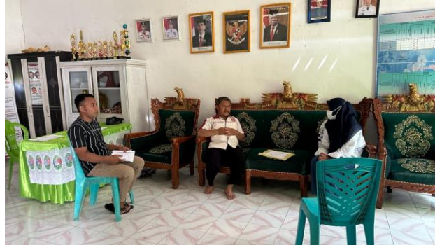
Gambar 2. Wawancara Bersama Narasumber

program prioritas. Keahlian PTPKD membantu kami mengevaluasi kondisi desa dengan cara menggali dan mengumpulkan data mengenai kondisi obyektif masyarakat serta permasalahan yang dihadapi.