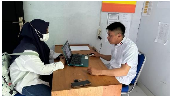
Gambar 1. Wawancara Bersama Narasumber

Kemampuan pribadi PTPKD dalam mengelola dana desa masih belum maksimal, hal ini dikarenakan masih banyak program yang belum terlaksana. Contohnya adalah program pelatihan ketrampilan dan pemberian permodalan bagi usaha UKM, dalam hal ini pemberian modal usaha , pelatihan usaha , pengadaan sarana prasarana usaha , pendampingan kepada kelompok tani , yang tentunya jika program ini dijalankan dapat meningkatkan rata-rata pendapatan usaha Komunitas . kurangnya pemahaman terhadap keterampilan pengelolaan dana desa, seperti keterampilan yang dimiliki perangkat belum maksimal, serta pengalaman menggunakan komputer, sehingga proses pelaksanaan program mengalami keterlambatan karena kurangnya kompetensi perangkat. dan kegagalan fungsi komputer selanjutnya.